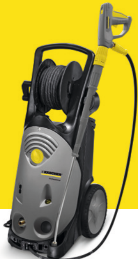
HD 10/21-4 SX Plus Farmer