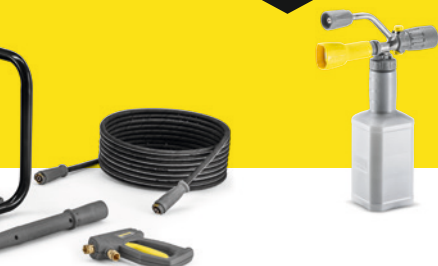
S St Classic Plus Farmer