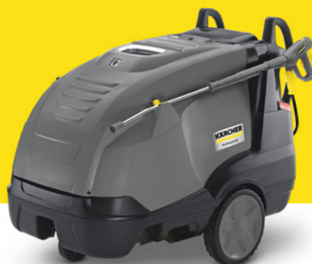
HDS 11/18-4 S Farmer