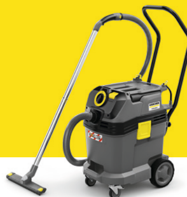
NT 40/1 Ap L Farmer