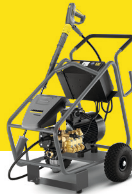
HD 16/15-4 Cage Plus Farmer